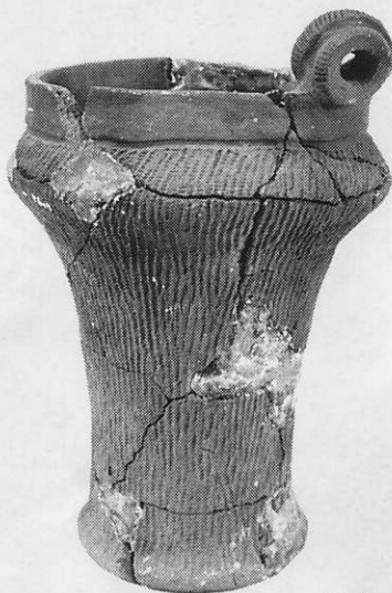
中期・勝坂Ⅲ式 屋敷山遺跡 高27.5cm(口縁まで)