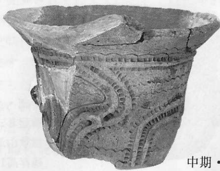
中期・ あたまだい 阿玉台Ⅲ式 やしきやま 屋敷山遺跡 残存高25.0cm

編集・発行 武蔵村山市立歴史民俗資料館 〒208武蔵村山市本町 5 - 21 - 1 T E L 0425(60)6620