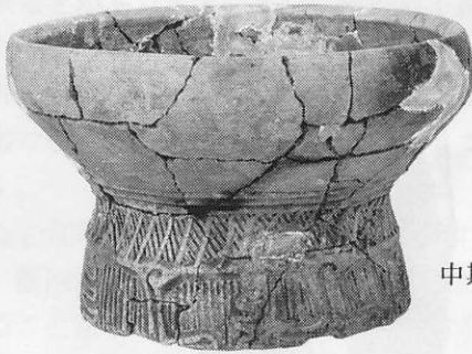
中期・ そり 曾利 II 式 屋敷山遺跡 残存高24.5cm