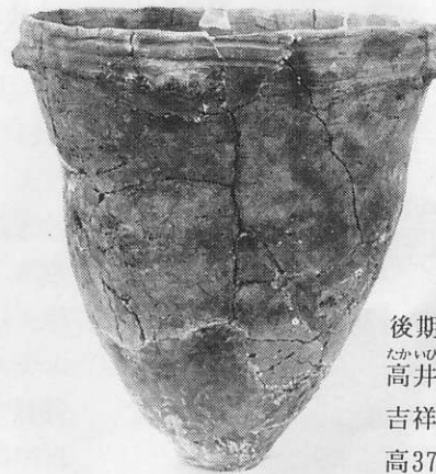
後期・ なかいひがし 高井東式(曾谷式併行) 吉祥山遺跡 高37.0cm