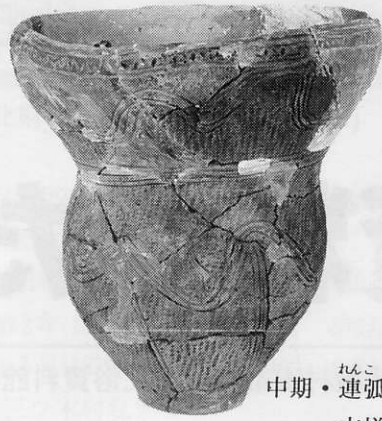
中期・ れんこもん 連弧文(加曾利E I式併行) 吉祥山遺跡 高38.5cm