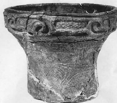
中期・ かそり 加曾利EⅠ式 きちじょうやま 吉祥山遺跡 残存高15.0cm