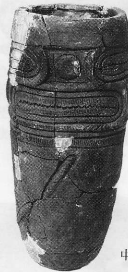
中期・ かつさか 勝坂Ⅱ式 屋敷山遺跡 高31.9cm