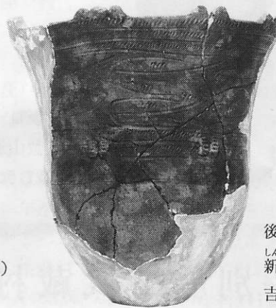
後期・ しんち 新地式(安行II式併行) 吉祥山遺跡 残存高18.0cm