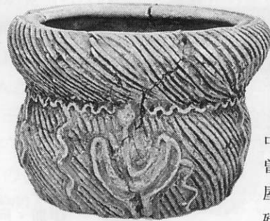
中期・ 曾利 II 式 屋敷山遺跡 残存高14.3cm