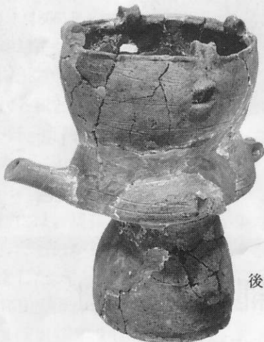
後期・高井東式(曾谷式併行) 吉祥山遺跡 高23.0cm(口縁まで)