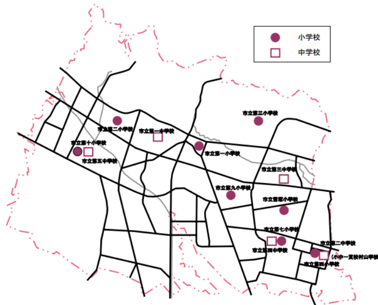
小学校および中学校配置図