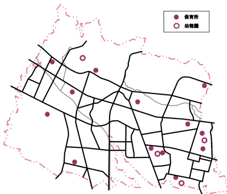
保育所及び幼稚園配置図