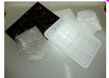
緩衝材・中仕切り