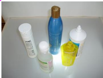
化粧品や食料品のボトル