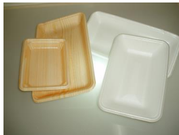
発泡スチロールトレイ