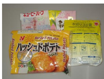
食料品・日用品の袋類