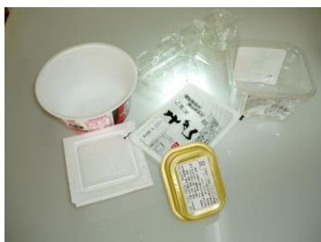
食料品・日用品のカップ、バック類