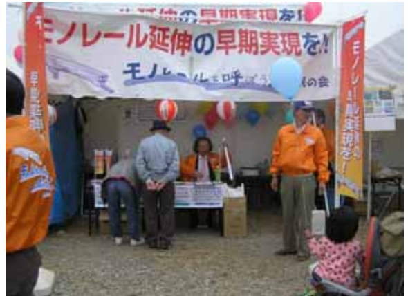
市民の会特設ブースでのPR・署名活動等

また、同日会員募集も行われ、当日入会された若い夫婦から「活動に是非協力したい」、年配者から「頑張ってる」との声掛けがあったとのことでした。