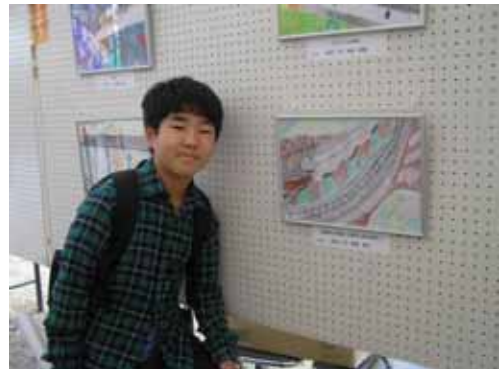
作品テーマ：武蔵村山の風景 ～現在から見た未来～