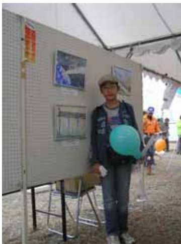
作品テーマ：みらいをつなぐ茶畑と新青梅街道の上を走る多摩都市モノレール