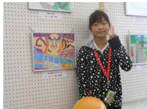
作品テーマ：夢と希望を運ぶモノレール