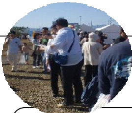
デエダラまつりでの のヒアリング調査