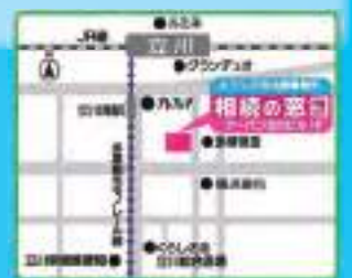
▲ JR立川駅 徒歩3分