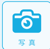
写真 写真送付で最短30分

まずはLINEでお友達登録！ LINE登録後、3つのお見積もり方法で すぐにご依頼いただけます。