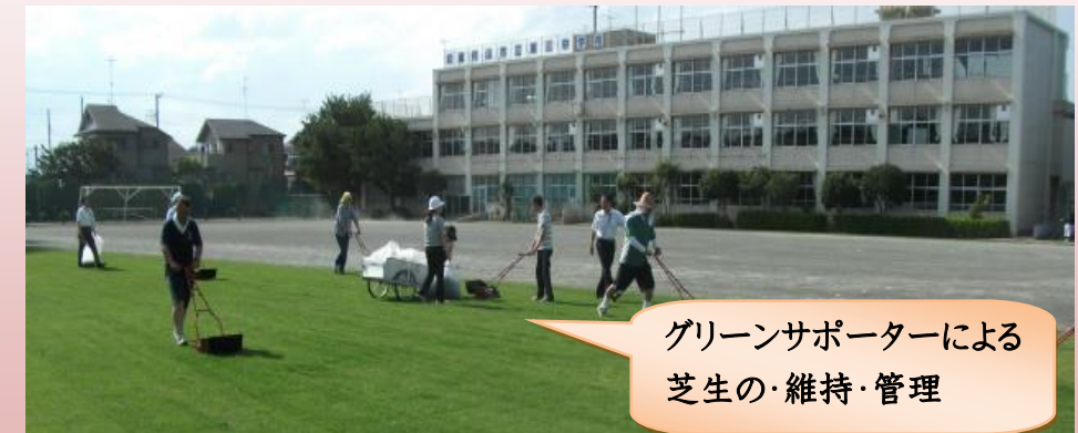
グリーンサポーターによる 芝生の維持・管理

学校施設の点検として校舎内外の施設・設備の点検を実施しています。また、校庭の芝生については本校の学校運営協議会委員の方がグリーンサポーターとして芝生の維持・管理に活動してくれています。