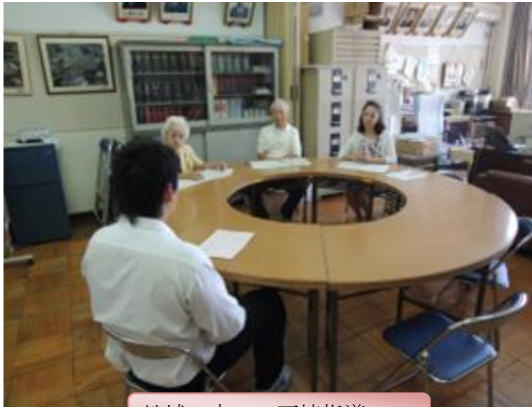
地域の方々の面接指導