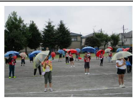
練習の様子です。上が1年生、下が4年生です。

保護者の皆様におかれましては、お願いすることばかりになり恐縮ではございますが、子供たちの安全で安心な運動会の成功のために、御理解と御協力をいただけますようお願い申し上げます。