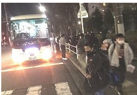
帰りはやや遅くなりましたが無事に到着