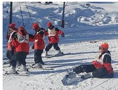
早速スキー講習、早速雪と触れ合う