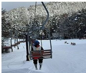
貸し切り状態のゲレンデ