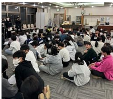
二日目の夜はレク大会で盛り上がる