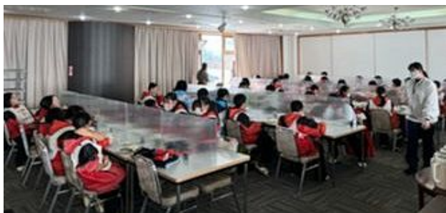
昼食は宿自慢の特性カレー お替り一杯だけでは物足りない