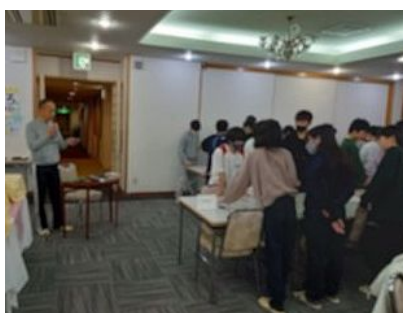
1日目夕食後は百人一首大会