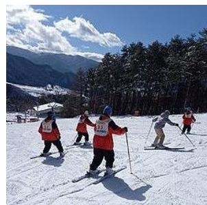
山の上からは眺めも最高