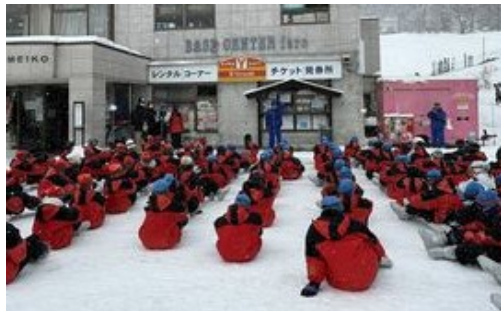
期待いっぱいの開校式