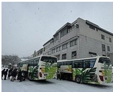
バスはほぼ予定通り無事到着

「雪を感じろ!! 東京では感じられない自然にふれ 楽しく安全に 一生の思い出を」 このスローガンのもと実行委員会を中心に1年生全員で創り上げたスキー教室は天候、雪質に恵まれ大成功！