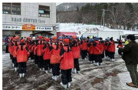
楽しかった三日間もあっという間に閉校式を迎える