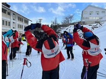
睡眠十分で二日目の講習開始