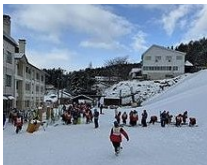
最終日は慣れた様子で講習が始まる