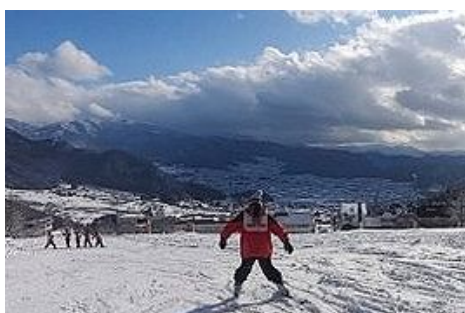
ちらついた雪もやんで青空がのぞく