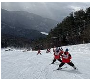
レッスンの成果で初心者もスイスイ