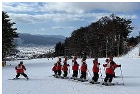
友達と一緒になのでスキーもどんどん上達する