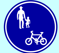
自転車通行可標識