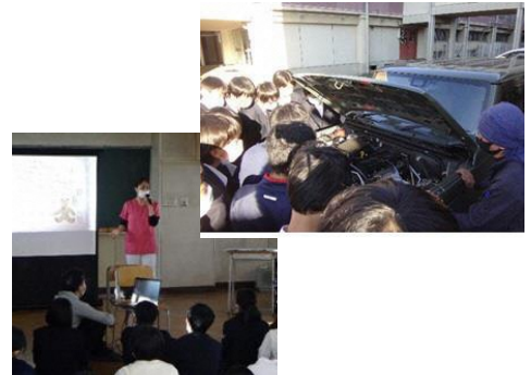
職業講話「プロから学ぶ会」