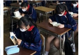
全クラスで朝読書を実施