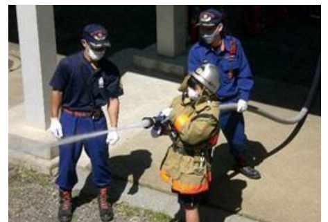
「五中フェスティバル」での体験学習