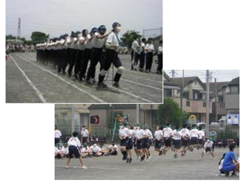
生徒の手で創り上げる「運動会」