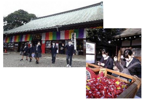
礼儀・自律・協力を目指した「川越遠足」