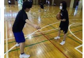
個性を伸ばす部活動