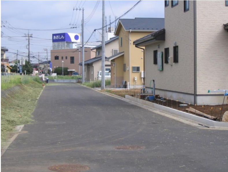
↓①区画道路築造7号工事（平成21年度施工）