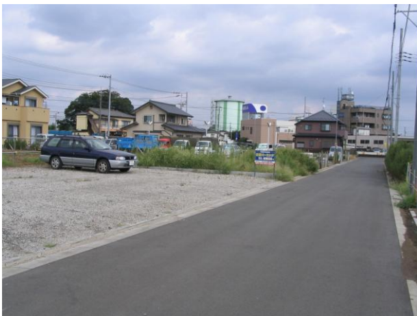
↓③仮換地指定された街区 （平成19～21年度一部指定）