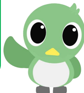
武蔵村山市広報キャラクター 「Mジロ」