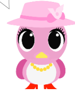
武蔵村山市広報キャラクター 「Mザベス」