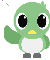
武蔵村山市広報キャラクター 「Mジロ」