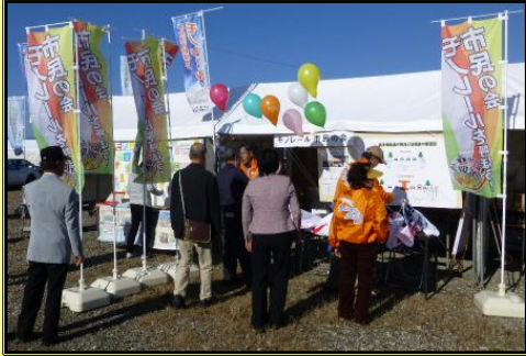
「モノレールを呼ぼう！市民の会」ブース (昨年の村山デエダラまつり)