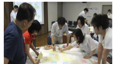
（ワークショップのイメージ）

一方的に講座を受けるのではなく、参加者が実際に参加・体験する講習会の手法です。参加者の皆さんによる各グループでの自由な発想や思いから討議を通して、将来の公園づくりについて考えていただきます。