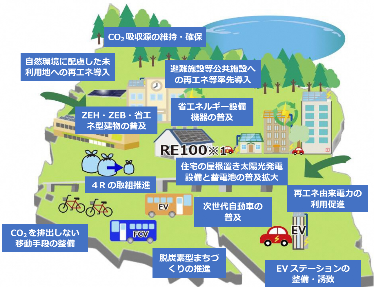
図表 3-2 本計画期間で目指す姿

このほか、将来像の実現に至る過程において、SDGsの考え方のもと、気候変動対策を進めることで、まちづくりに関する様々な課題に対しても波及効果を生み出せるよう、取組を推進します。