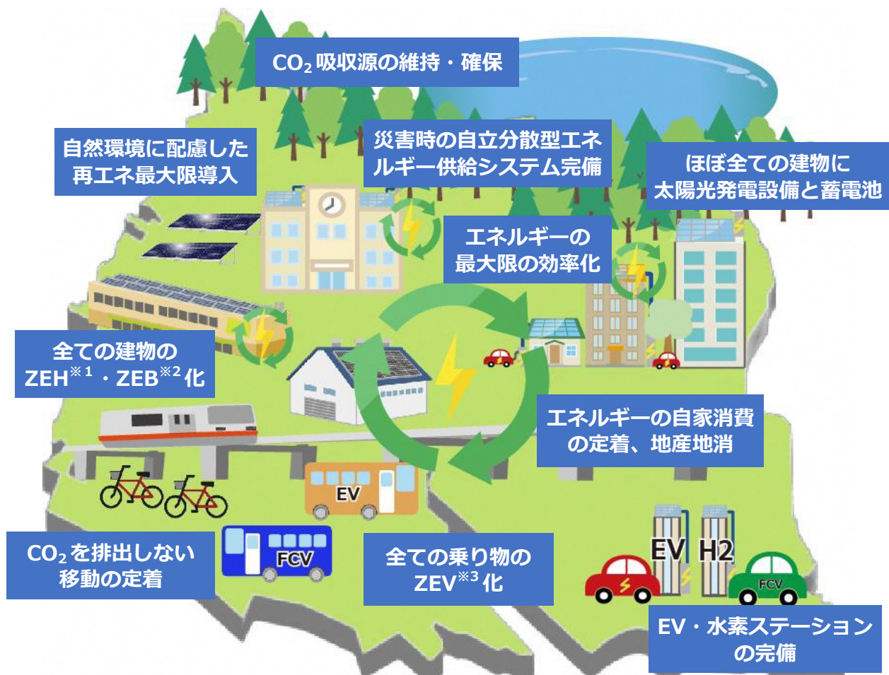
図表3-1 ゼロカーボンシティを実現した2050年の本市の姿

個々の住宅や建物、乗り物が、エネルギー性能を高めて必要なエネルギー量を最小化し、再生可能エネルギーを生産・利用することで、将来像の実現を目指します。