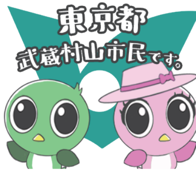
市広報キャラクター M ザベス