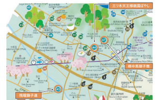
武蔵村山めぐり（武蔵村山観光まちづくり協会）