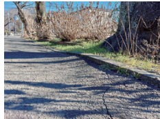
根上による舗装面等の劣化