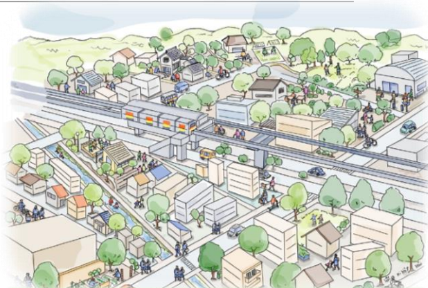
(仮称)No. 5駅 帰ってきたいと思える緑のまち