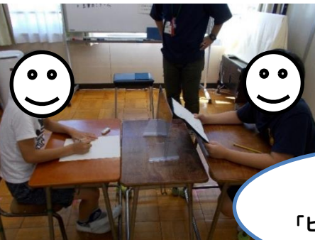
えのきタイム 「ピクチャーゲーム」