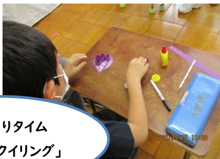
ものづくりタイム 「ぶどうのクイリング」