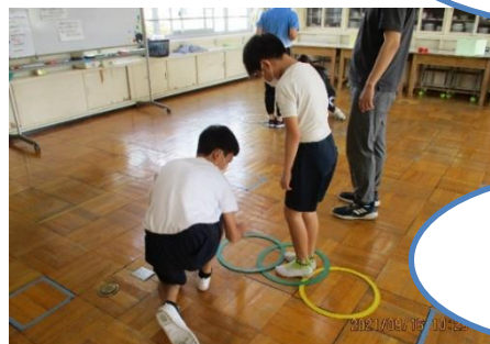
運動タイム 「橋渡しリレー」

授業参観週間では、上記の写真のような様子を直接、ご覧頂けます。子供たちが生き活きと学ぶ姿を楽しみにいらして下さい。