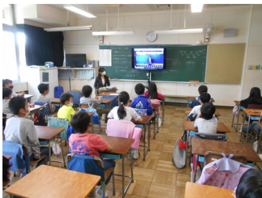
【感染防止に配慮したオンライン離任式】

このように例を挙げてみるだけでも、授業が楽しくなったり、可能性が広がったりすることに、とてもわくわくします。（オンライン授業のテストとして、先日の離任式をオンラインで実施しました。）