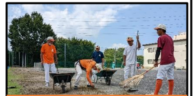
グリーンサポーターとして活動する野球チーム青空の皆様

これまで練習に励んできた子供たちは、当日のたくさんの拍手を楽しみにしております。学校と地域と保護者全員で、子供たちが輝く運動会にできたらと願っております。御協力のほどよろしくお願いいたします。