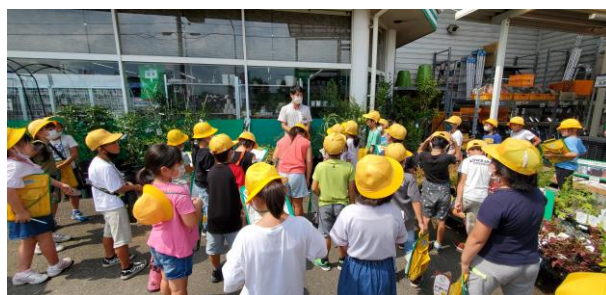
【地域のお店を訪問する2年生】

普段何気なく歩いているところに、新しい発見がたくさんあったようで、2年生の子供たちはとても満足して帰ってきました。