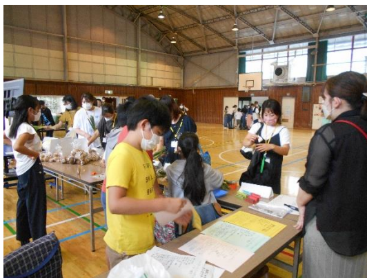
【体育館（マーケットエリア）での販売体験】

夏休み前になりますが、 十小夏まつり には多くの保護者の方に御来校いただき、ありがとうございました。コロナによるブランクの間に、熱中症対策のための屋内開催、大人主体から子供主体へとリニューアル計画を進め、今年度は無事に開催することができました。