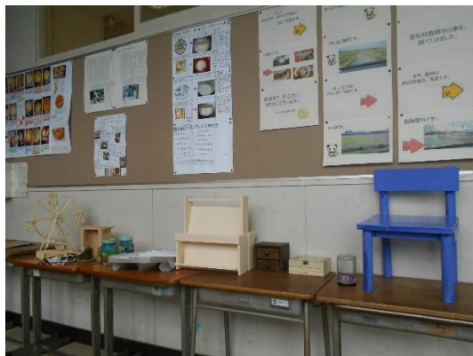
【廊下に並んだ自由研究や自由工作】

夏休み明けは、各教室にたくさんの 自由研究や自由工作 が並びました。私はこれを毎年楽しみにしています。